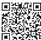
รายงานข้อมูล